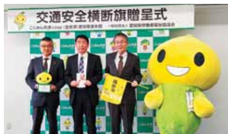
こくみん共済Coop愛媛推進本部 (一社)愛媛県労働者福祉協議会 横断旗贈呈式 (R5.11.15)

多くの企業・団体様からご寄贈いただきありがとうございます。 ご寄贈いただいた反射材等は県内の交通安全活動で活用させていただいています。