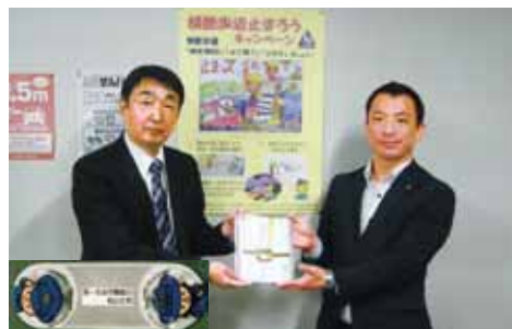
第一生命労働組合 反射材贈呈式 (R5.11.10)