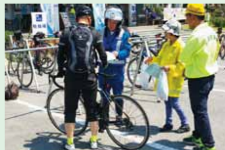
昨年の啓発活動の様子 (伯方地区交通安全協会)