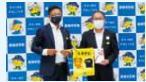
渡部前西条西協会長への感謝状贈呈