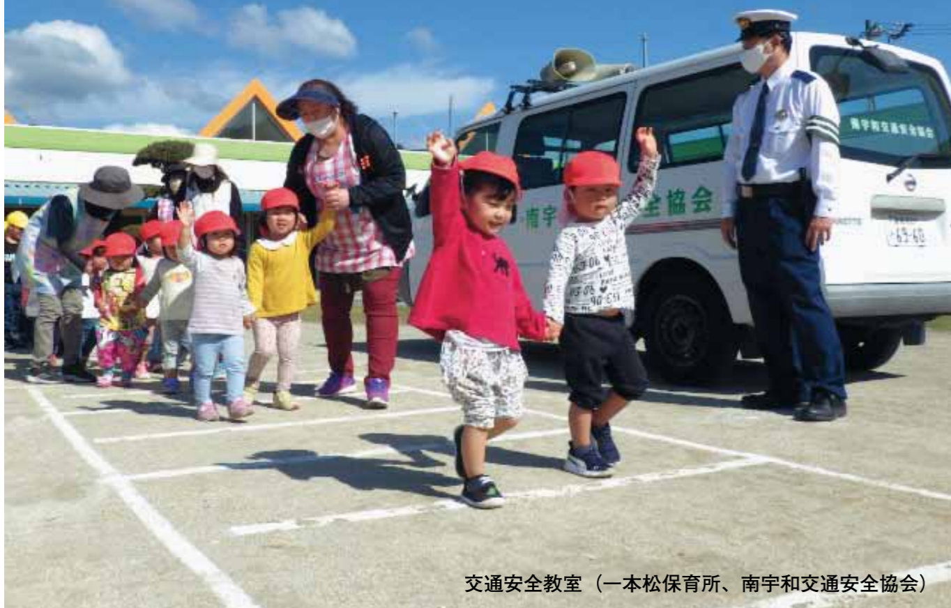
交通安全教室 (一本松保育所、南宇和交通安全協会)

交通安全協会は こどもたちの命を守る活動をしています 各種活動に 引き続き ご協力をお願いします