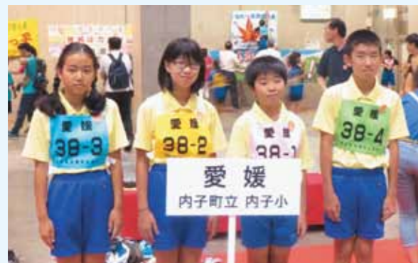
愛媛県代表(内子小)チーム