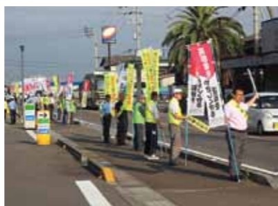
人の輪作戦 7/20 西条市小松町

「ム」チャするな「ジ」カンにゆとり「コ」コロのよう 「シェア・ザ・ロード」の精神の普及促進と 自転車乗車用ヘルメットの着用促進