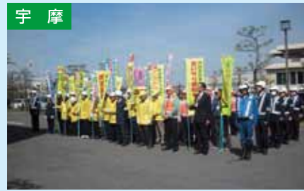
春の全国交通安全運動出陣式 4/6 四国中央警察署