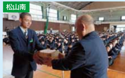
高校生(5校)に自転車反射材贈呈 4/14 東温高校