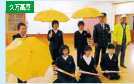
新入学児童に黄色反射傘贈呈 4/7 久万小学校