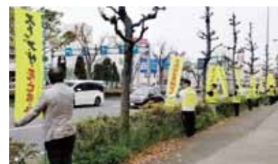
人の輪作戦 4/10 天山交差点