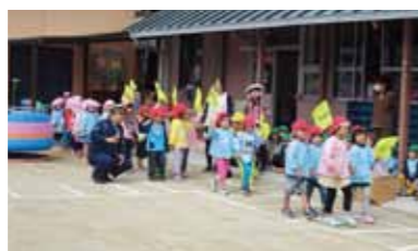
交通安全教室 4/11 古川保育園