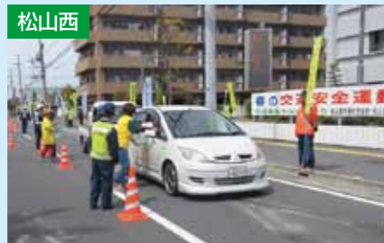
交通安全茶屋及び人の輪作戦 4/6 松山西警察署前