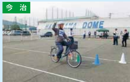
高齢者交通安全自転車大会 4/9 波止浜興産自動車教習所