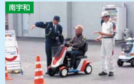
あいなん「じこなーし」教室 4/9 愛南警察署