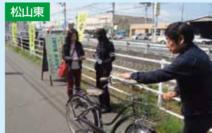
自転車無料点検 4/14 マルヨシ山越店前