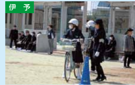
自転車交通安全教室 4/12 双海中学校