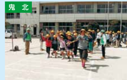
交通安全教室 4/12 近永小学校