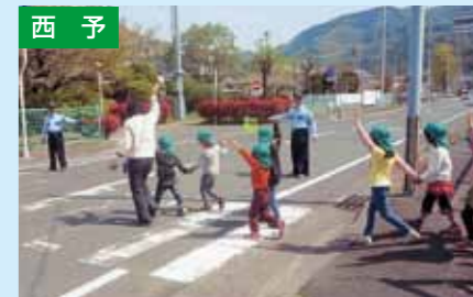
交通安全教室 4/12 西予市三瓶町