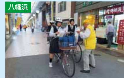
反射材を着用！ボトル作戦 4/8 新町ドーム横