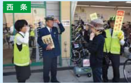
ヘルメットアドバイザー店での着用呼びかけ 4/15 フジグラン西条