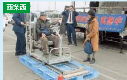
高齢者事故防止啓発キャンペーン 4/11 周ちゃん広場