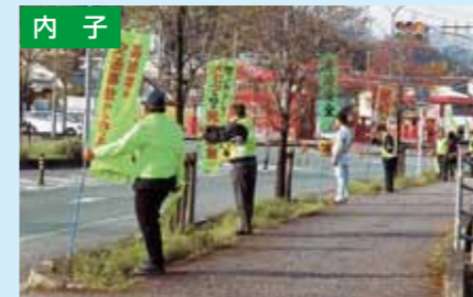
人の輪作戦 4/12 内子交番前