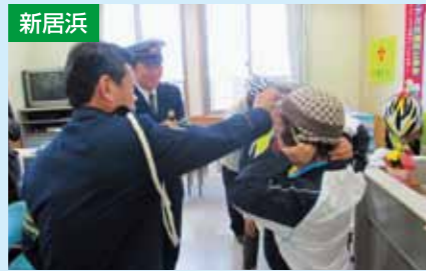
高齢者交通安全モデル地区指定式 4/11 泉川公民館