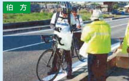
交通安全茶屋 4/11 今治市宮窪町