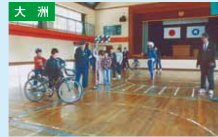
自転車交通安全教室 4/12 白滝小学校