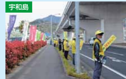
人の輪作戦 4/6 きさいや広場