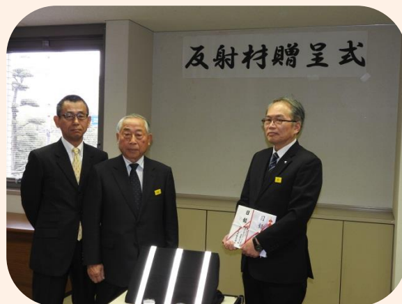
(高輝度リストバンド)